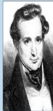
Victor Hugo (1802-1885)

Victor Hugo est rentré en France après l'abdication de Napoléon, acclamé comme un héros. Devenu sénateur, il a pris le parti des opprimés°, des déshérités, des gens sans protection et sans ressources et il s'est battu° pour la liberté, l'égalité et la justice. C'est cet esprit de compassion pour les petits gens qu'il manifeste dans sa grande oeuvre° Les Misérables .